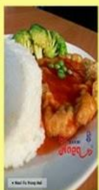
Nasi Fu Yung Hai