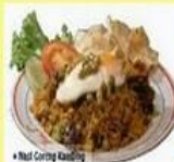
Nasi Goreng Kambing