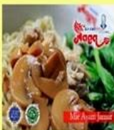
Bakmi Ayam Jamur