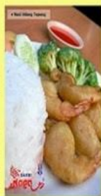
Nasi Udang Goreng Tepung