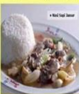
Nasi Ca Sapi Jamur