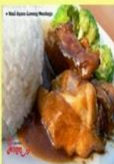
Nasi Ayam Goreng Mentega