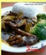
Nasi Sapi Lada Hitam