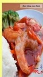
Nasi Udang Asam Manis