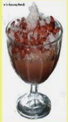
Es Kacang merah