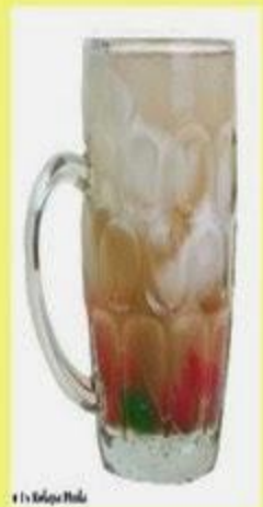
Es Kelapa Muda